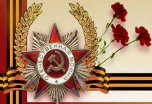
Фото не сохранилось

Список наград: Орден Красного Знамени; Орден Отечественной войны I степени; Орден Отечественной войны II степени.